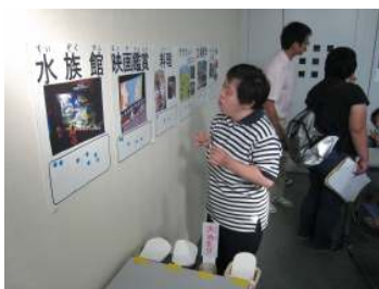
どれが楽しそうかな～？！

懇談会は「今、思うこと」というテーマで日頃聞けない会員さん達の声を聞く事ができました。本人部会は、「行ってみたい場所・やってみたいことを考えよう」というテーマで行われました。掲示したイベントやアトラクションの絵や写真を見て、希望するものにシールを貼って投票するという方法で、希望の多かったものを今後活動で実現できる様働きかけることを約束しました。ランキング：1位はテーマパーク☆ 2位はスーパー銭湯でした♪