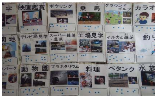
みんな、やりたいこといっぱいです！！