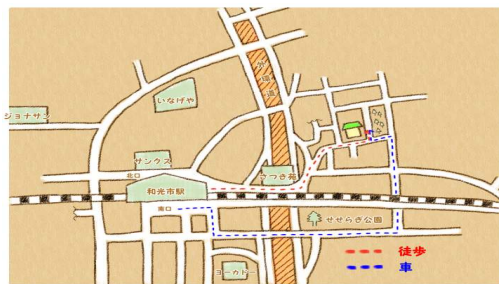
<和光市駅北口から徒歩5分>