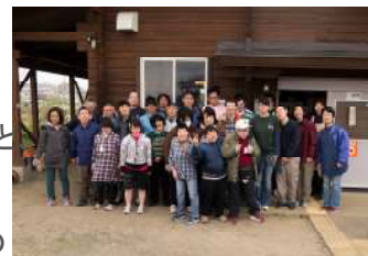
2012年3月31日 ポコ・ア・ポコ バーベキュー大会 アグリパークにて

強風が吹き荒れアグリパーク周辺は一時砂嵐でした。そんな天気の中を総勢40名とたくさんの人たちにお集まりいただきました。すわ緑風園から参加された方もいて、とてもにぎやかになりました。風が強かったので建物の中で焼きそばや焼き肉などのバーベキュー料理、豚汁、杏仁フルーツを食べることになりましたが料理は美味しく、あちこちで話が盛り上がっていました。景品獲得を目指したピンポン玉転がしゲームとゴム鉄砲的当てゲームにもたくさんの方が挑戦してくれました。桜はどこにも咲いていませんでしたが、参加された皆様が色とりどりの花そのものようだったので、この上ない「お花見」になったと思います(^o^)