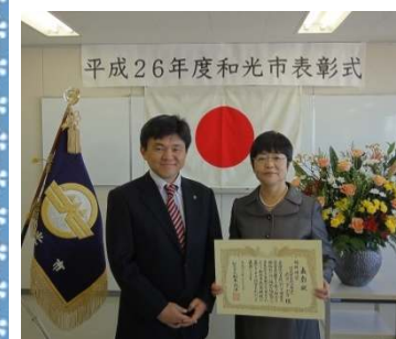
平成26年度和光市表彰式