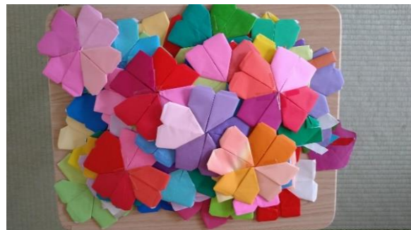
大量に作ったクローバー